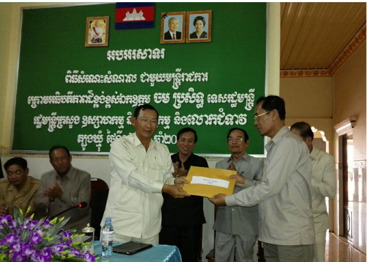
ឯកឧត្តមទេសរដ្ឋមន្ត្រី ចម ប្រសិទ្ធ អមដំណើរដោយថ្នាក់ដឹកនាំក្រសួងឧស្សាហកម្ម និងសិប្បកម្ម ក្នុងពេលបំពេញ បេសកកម្មចុះសាកសួរសុខទុក្ខមន្ត្រីរាជការ មន្ទីររដ្ឋបាលខេត្តត្បូងឃ្មុំ កាលពីថ្ងៃទី១៩ ខែធ្នូ ឆ្នាំ២០១៥។

រៀបចំដោយ៖ ន.ផែនការ ស្ថិតិ សហប្រតិបត្តិការ និងការងារអាស៊ាន (កឧសក)