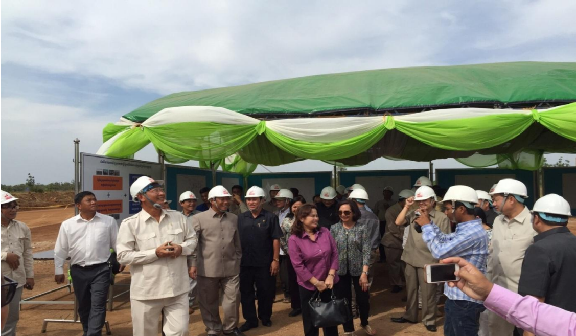
វត្តមានថ្នាក់ដឹកនាំក្រសួង ឧស្សាហកម្ម និងសិប្បកម្ម ក្រោមអធិបតី ឯកឧត្តមទេសរដ្ឋមន្ត្រី ចម ប្រសិទ្ធ ក្នុងបេសកកម្មចុះពិនិត្យរោងចក្រផលិតទឹកស្អាតនៅខេត្តក្បុងឃ្មុំ កាលពីថ្ងៃទី១៩ ខែធ្នូ ឆ្នាំ២០១៥។

នាថ្ងៃទី១៩ ខែធ្នូ ឆ្នាំ២០១៥ ឯកឧត្តមទេសរដ្ឋមន្ត្រី ចម ប្រសិទ្ធ បានអញ្ជើញចុះពិនិត្យការដ្ឋានសាងសង់រោងចក្រផលិតទឹកស្អាតដែលកំពុងសាងសង់ជិតរួចរាល់ព្រមទាំងបានចុះសាកសួរសុខទុក្ខមន្ត្រីរាជការ មន្ទីរឧស្សាហកម្ម និងសិប្បកម្ម ខេត្តក្បុងឃ្មុំ។