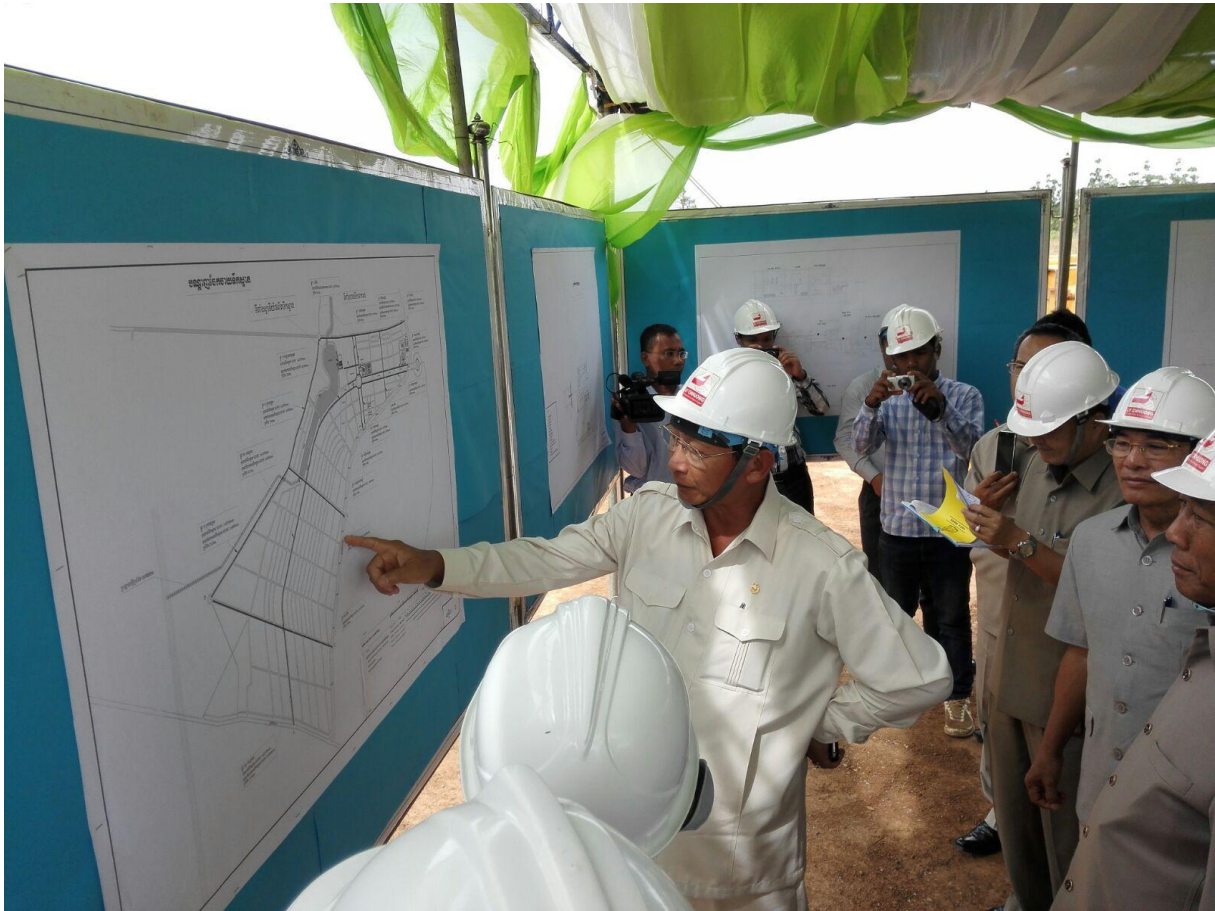
ឯកឧត្តមទេសរដ្ឋមន្ត្រី ចម ប្រសិទ្ធ អញ្ជើញចូលរួមចុះសាកសួរសុខទុក្ខមន្ត្រីរាជការ មន្ទីរឧស្សាហកម្ម និងសិប្បកម្ម ខេត្ត ក្បុងឃុំ ថ្ងៃទី១៩ ខែ ធ្នូ ឆ្នាំ២០១៥

ជួបសំណេះសំណាលជាមួយមន្ត្រីរាជការ របស់ឯកឧត្តមបណ្ឌិត ចម ប្រសិទ្ធ ទេសរដ្ឋមន្ត្រី រដ្ឋមន្ត្រីក្រសួងឧស្សាហកម្ម និងសិប្បកម្ម ខេត្តក្បុងឃុំ ថ្ងៃទី១៩ ខែ ធ្នូ ឆ្នាំ២០១៥